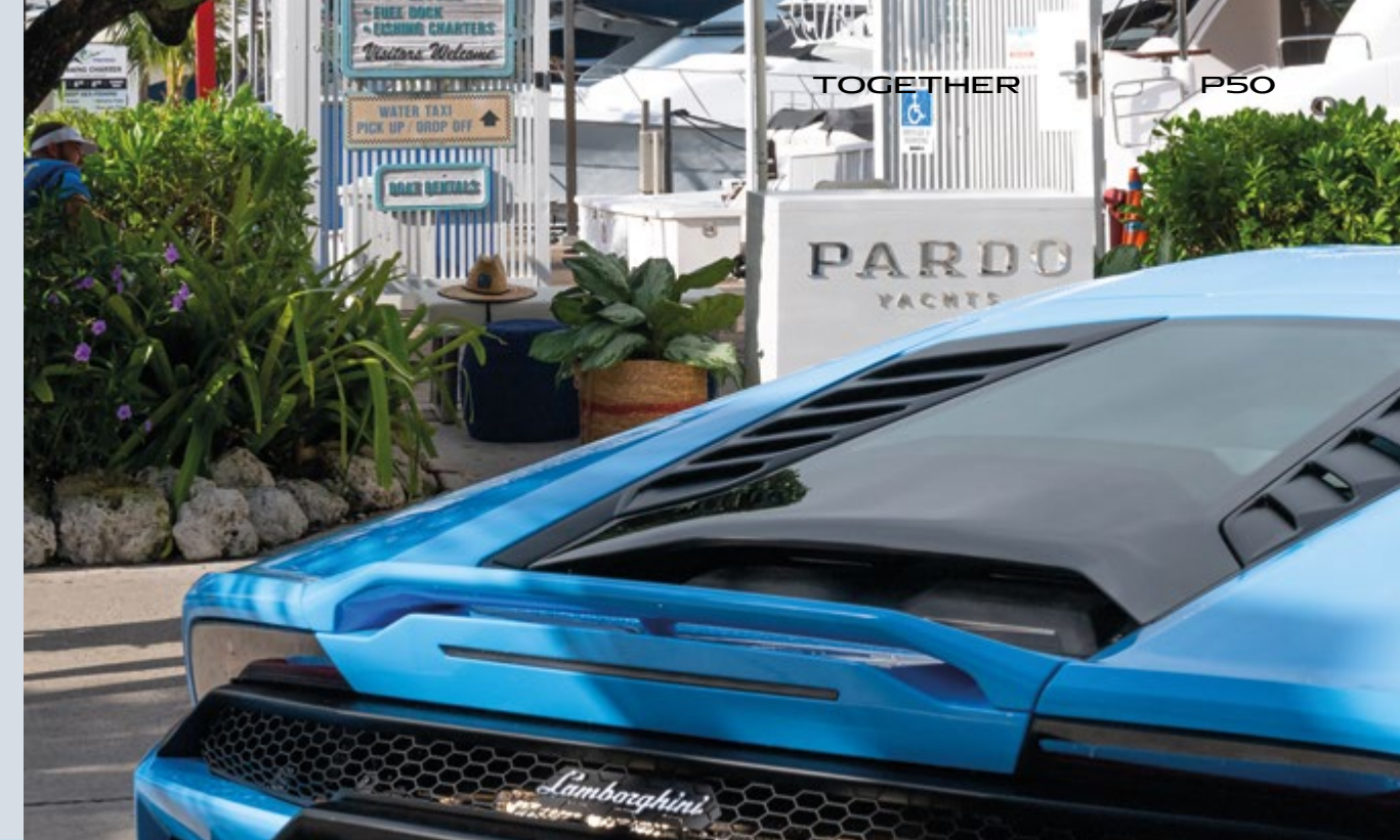
MIAMI - PARDO YACHTS & LAMBORGHINI