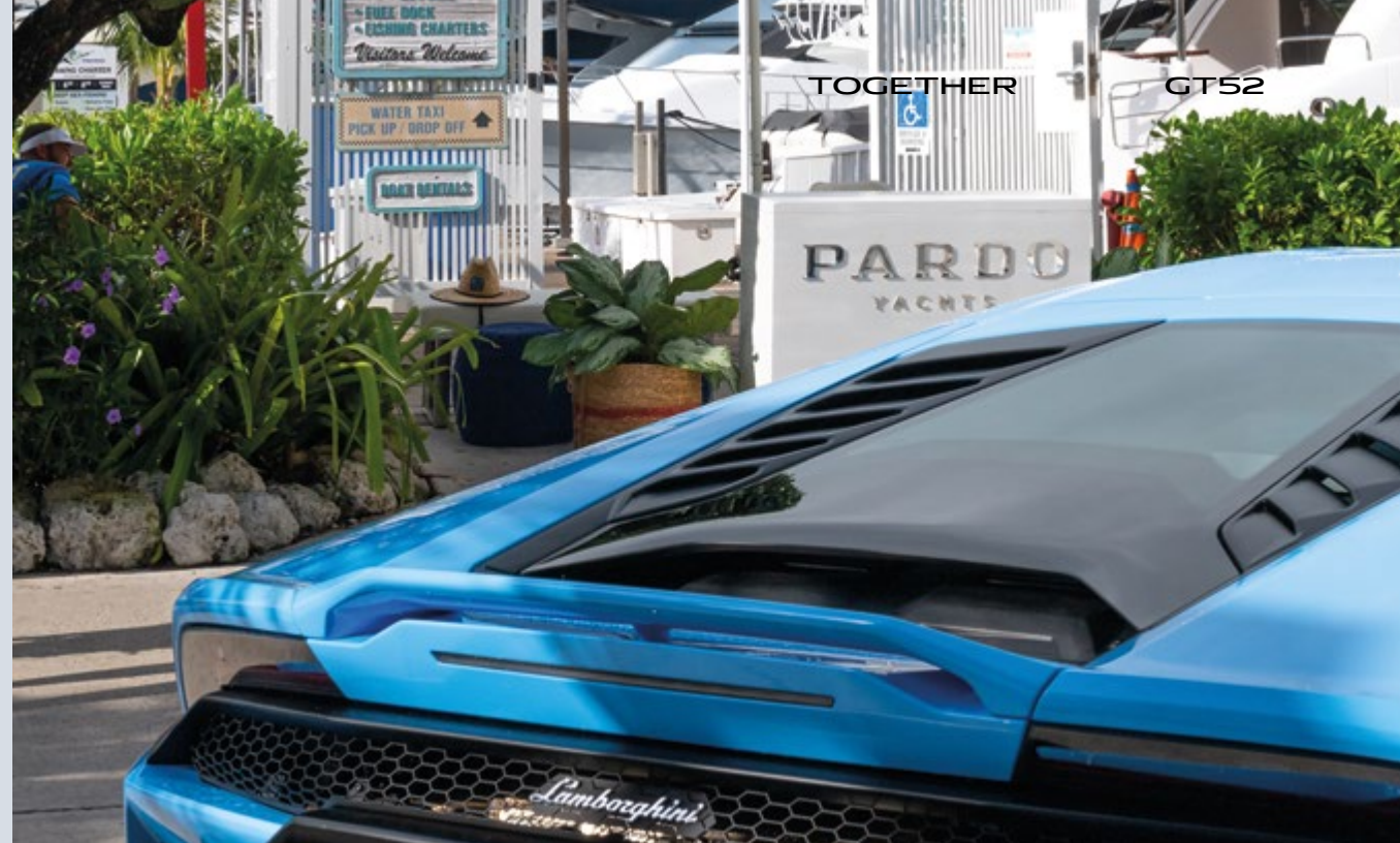
MIAMI - PARDO YACHTS & LAMBORGHINI