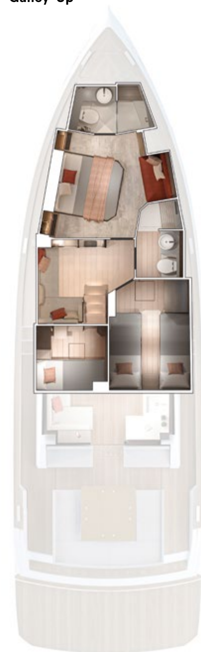
Lower deck Galley-Up