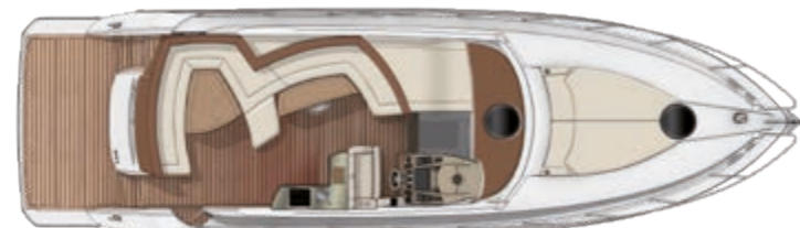
"DOUBLE COCKPIT" VERSION