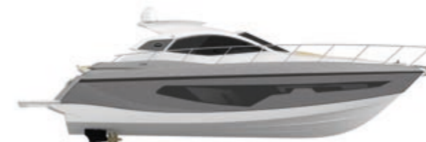
SILVER/GOLD METALLIZED (paint)