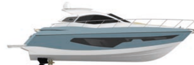
AIR BLUE (paint)