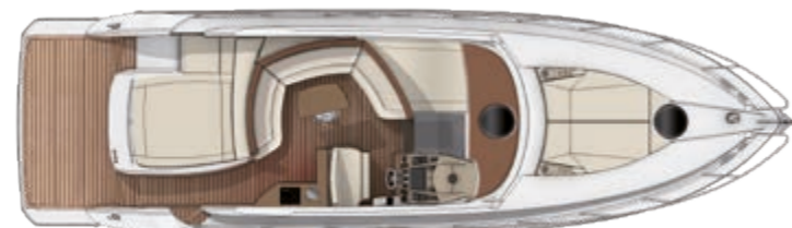
CLASSIC COCKPIT VERSION